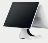
Écran client 9,7 pouces