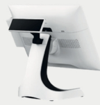
Écran client VFD