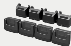
Station de recharge multiple