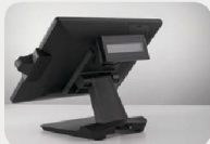
Écran client LCM

Rétroéclairage LED à faible consommation d'énergie et longue durée de vie (plus de 50 000 h). Châssis très robuste en aluminium moulé sous pression. Faces avant et arrière étanches poussière et eau (IP64). Système de refroidissement silencieux sans ventilateur