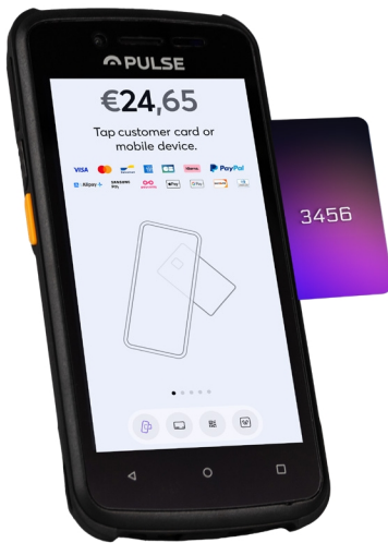
Acceptez les paiements grâce au lecteur NFC intégré

MODÈLE ENTRÉE DE GAMME PROFESSIONNEL Idéal intérieur et extérieur avec écran 5 pouces. Système Android 13 (avec GMS). Puissant processeur à huit cœurs (Octacore). Certifié Google GMS pour compatibilité maximale. Indice de protection IP67 et résistance aux chutes. Batterie haute autonomie.