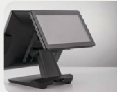
Écran client 8,4 pouces