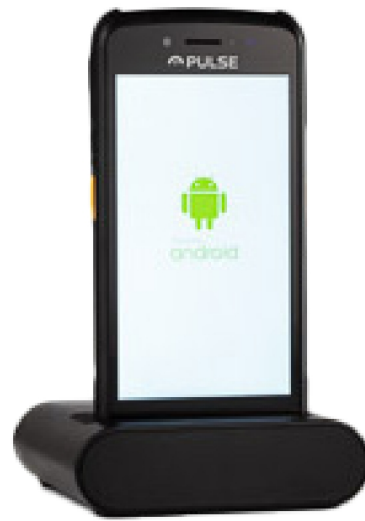
Station de recharge